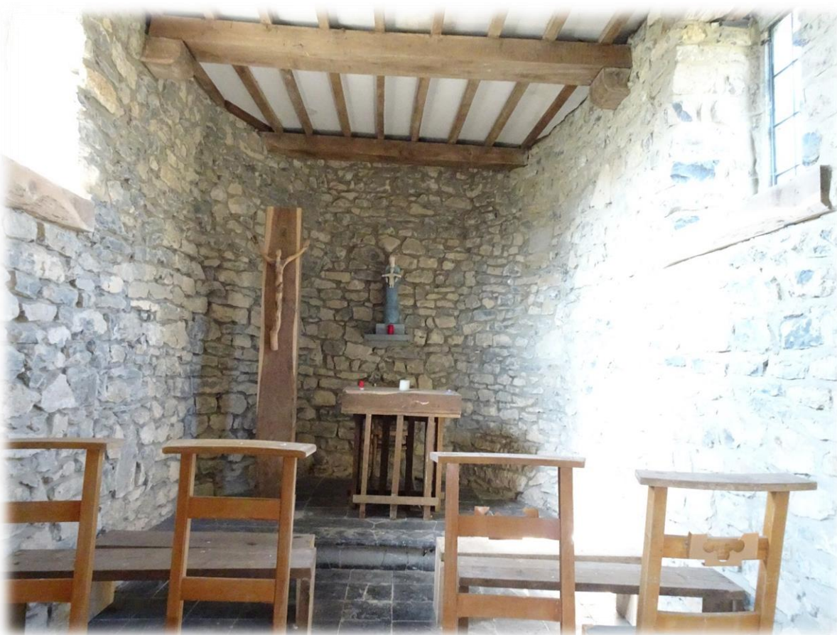
Het dorp Lavaux-Sainte-Anne dateert uit de Merovingische periode. Lavaux-Sainte-Anne hing vroeger af van het prinsdom van Luik en de inwoners dragen de bijnaam 'Petias', wat