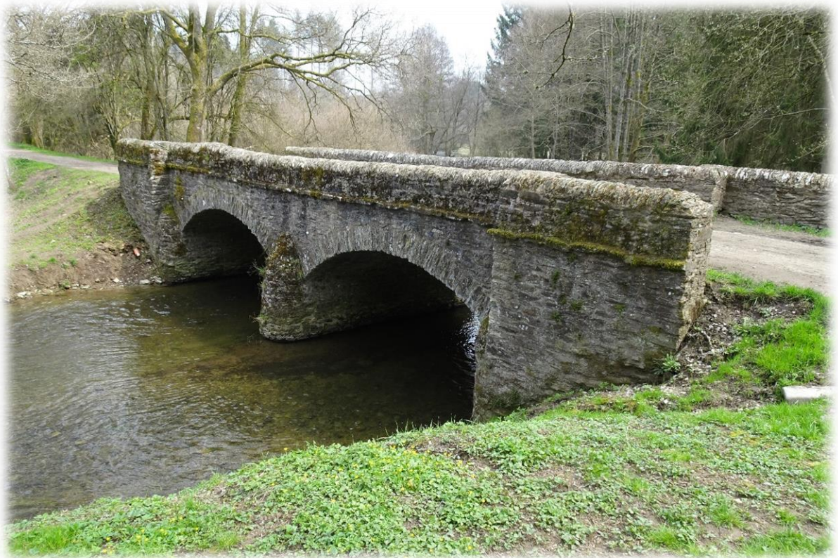
Nu steken we een aardige Lessebrug over, de Pont de la Justice. De brug is 19de eeuws en verving toen mogelijk een oudere brug over de Lesse aangezien het om een zeer oude weg