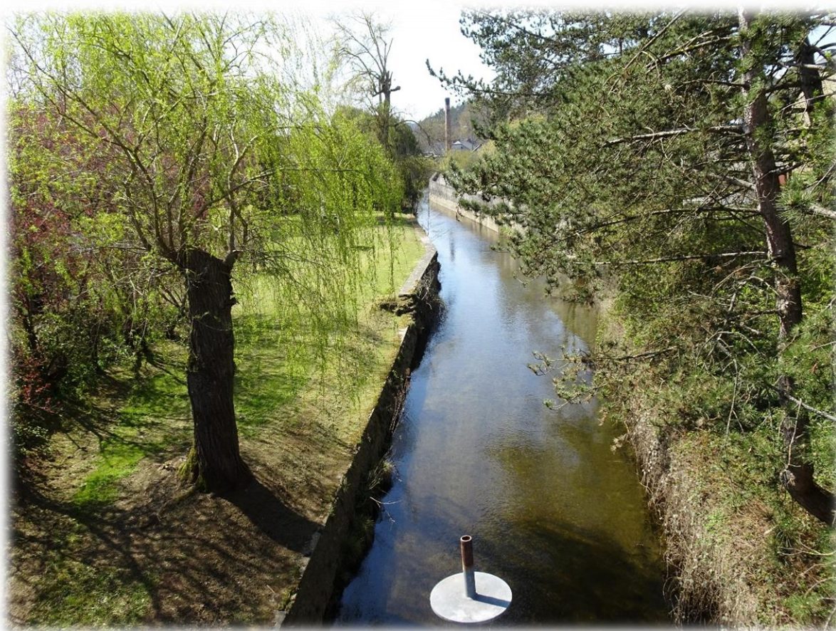
We komen terug aan een van de vele zijriviertjes van de Lesse.